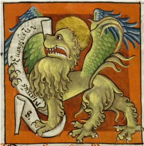
Miniature ouvrant l'évangile selon s. Marc (l'évangéliste est représenté sous la forme d'un lion). AAEB Cod. 326.

Dimanche, 15h00 – 15h30 (ouverture du bâtiment dès 14h45) : Les énigmes d'un magnifique manuscrit médiéval , par Jean-Claude Rebetez, conservateur