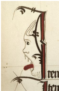
Lettrine I ornée d'une tête de démon

Un des trésors des AAEB est un superbe volume du 15 e siècle, très richement orné et connu sous le nom un peu énigmatique de Liber marcarum . Rédigé sur parchemin, il compte 264 pages de grand format – il a fallu les peaux de 66 moutons pour le fabriquer ! Nous présenterons cet ouvrage prestigieux et nous tenterons de résoudre six des énigmes qu'il pose. Par exemple : pourquoi ce volume rédigé sur ordre de l'évêque zu Rhein contient-il une... caricature d'évêque, présenté sous forme de démon portant la mitre ? Et les magnifiques armoiries de zu Rhein qui ouvrent le volume, sont-elles fausses ?